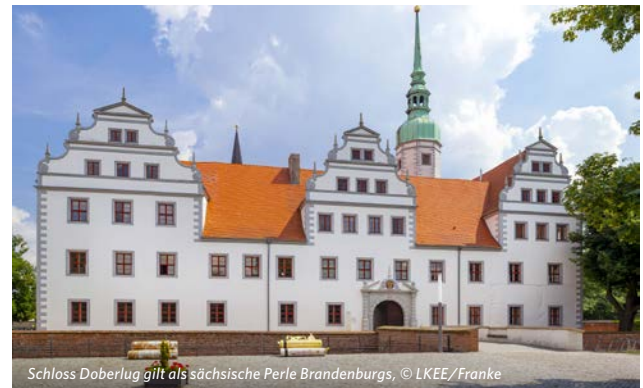
Schloss Doberlug gilt als sächsische Perle Brandenburgs, © LKEE/Franke