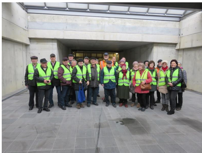
Fertig gestellter Teil des Personentunnels