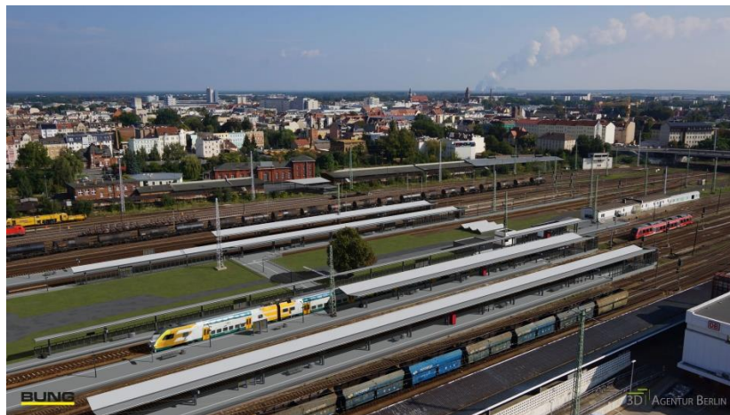
Bahnhof Cottbus nach Abschluss der Baumaßnahme

Interessierte Seniorinnen und Senioren der BTU Cottbus-Senftenberg trafen sich am Mittwoch, dem 10.01.2018 im Empfangsgebäude des Bahnhofs Cottbus und wollten mehr über die z. Z. größte Baustelle in Cottbus erfahren. Herr Härtner, Gesamtprojektleiter der DB Station & Service, Herr Samulat, ebenfalls DB Station & Service sowie Herr Hauzenberger, Projektleiter seitens der Stadt Cottbus, nahmen uns in Empfang und begannen die Führung auf dem Bahnsteig 1. Wir erfuhren alles über die wichtigen Veränderungen am Bahnhofsumfeld, die Neugestaltung des östlichen Bahnhofsvorplatzes bis zur Bahnhofstraße, -brücke, die Verlängerung und Erneuerung des Personentunnels. Wir erfuhren, dass 290 Langzeit- und 85 Kurzzeitstellplätze sowie 6 Kiss-and-Ride-Plätze geplant sind und für die Fahrradfahrer 260 Abstellplätze errichtet werden sollen.